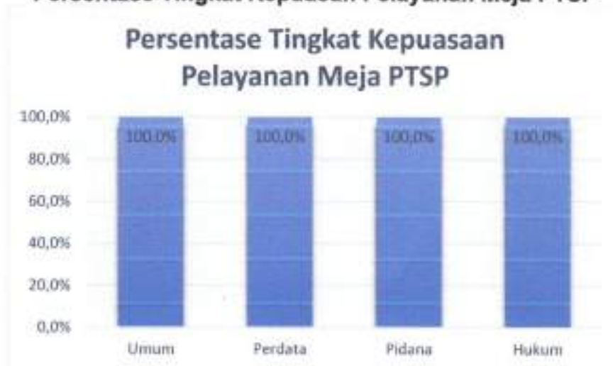
Persentase Tingkat Kepuasan Pelayanan Meja PTSP