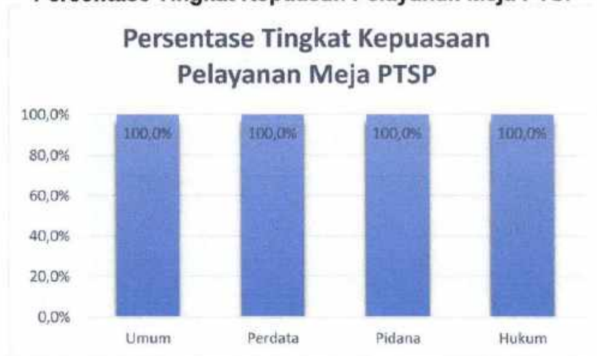
Persentase Tingkat Kepuasan Pelayanan Meja PTSP