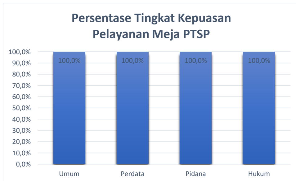
Tabel 1. Persentase Tingkat Kepuasan Pelayanan Meja PTSP